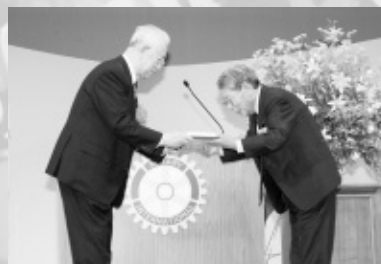
RI会長賞が蔵並会長代理より授与された