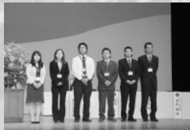
ローターアクトクラブ紹介