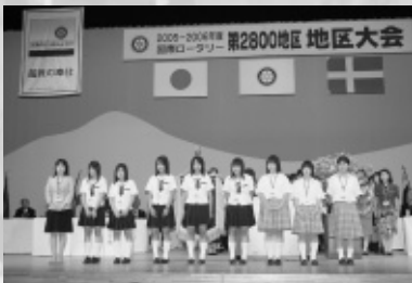
インターアクトクラブ紹介(九里学園高校)