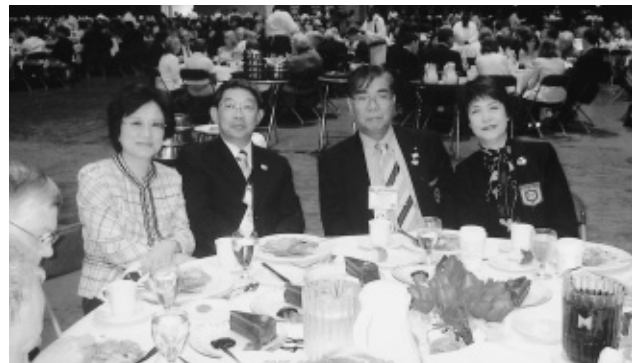
写真は6月のシカゴ国際大会で許ガバナー御夫妻と撮ったものです。

米山記念奨学会、ロータリー財団の両者とも我々ロータリアンの寄付によって運営されておりますが、寄付は強制するものではなく、会員の理解があって初めて寄付を頂くものと思います。それにはDonationからContributionへの意識改革が求められます。