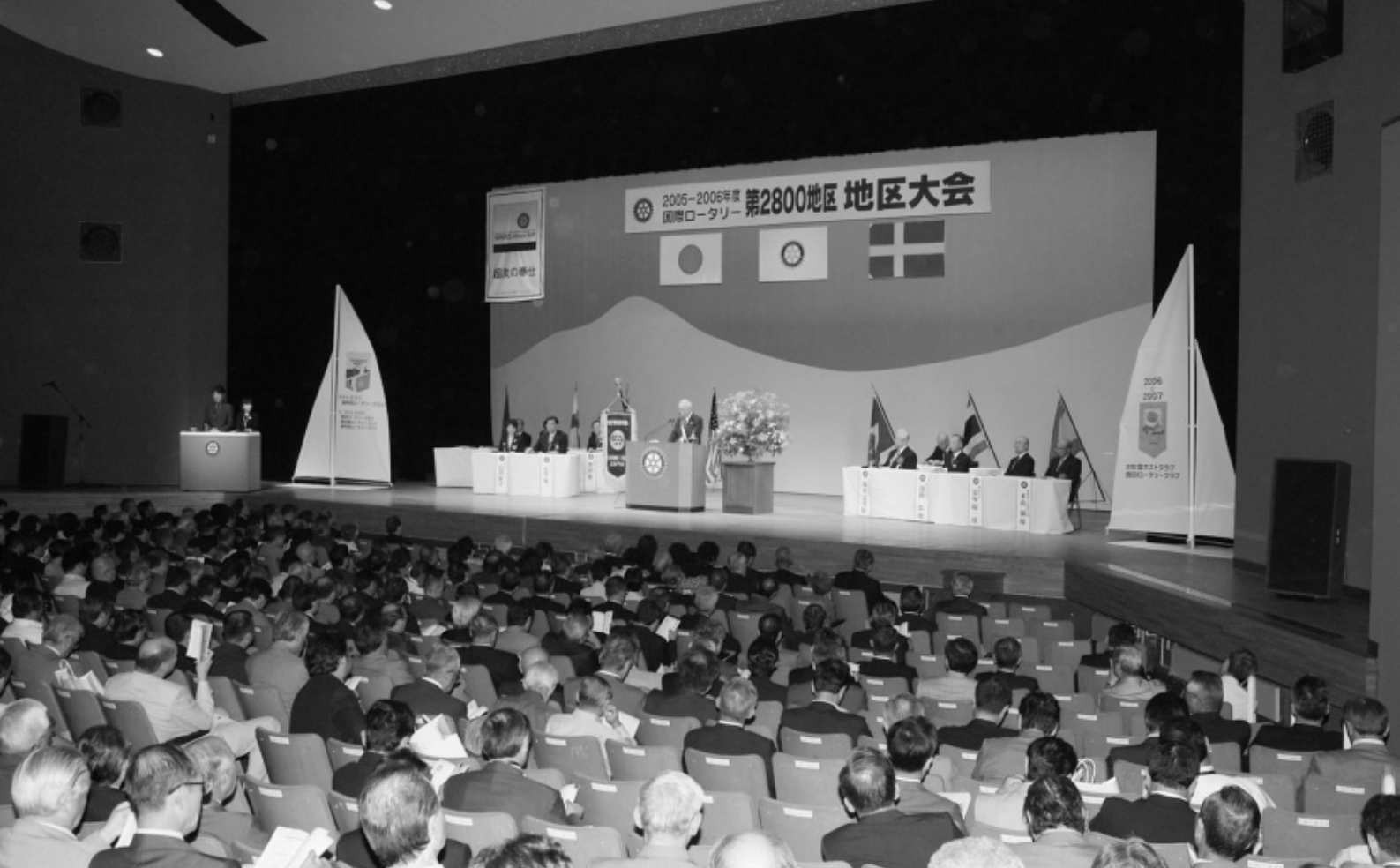
国際ロータリー第2800地区 2005-2006年度地区大会（9月17日(土) 於：鶴岡市文化会館）