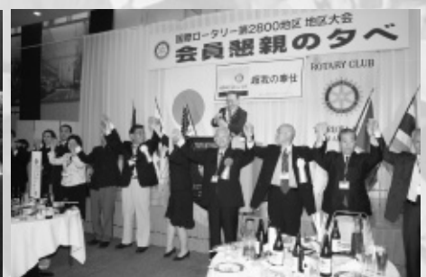
ロータリーソング「手に手つないで」