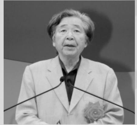
記念講演師 山田洋次監督