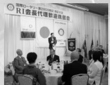
RI会長代理歓迎晩餐会