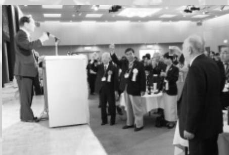
豊田義一直前ガバナーの発声で乾杯