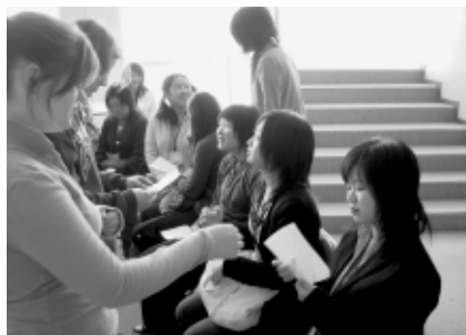
受け入れ学生が先生