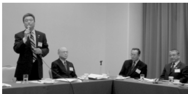
両地区のガバナーエレクト・ガバナーノミニ