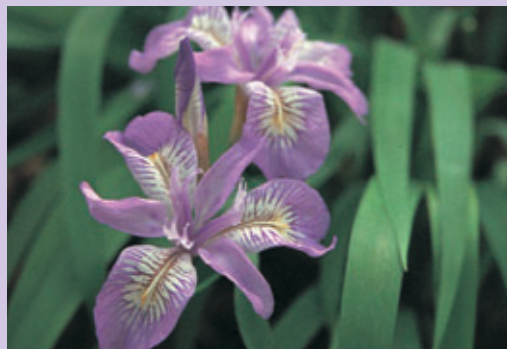
ヒメシヤガ—アヤメ科—