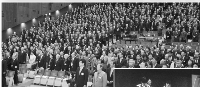
◀ 第2回本会議がスタート