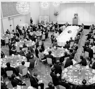
RI会長代理歓迎晩餐会