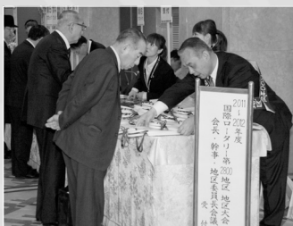
地区大会の始まりです。