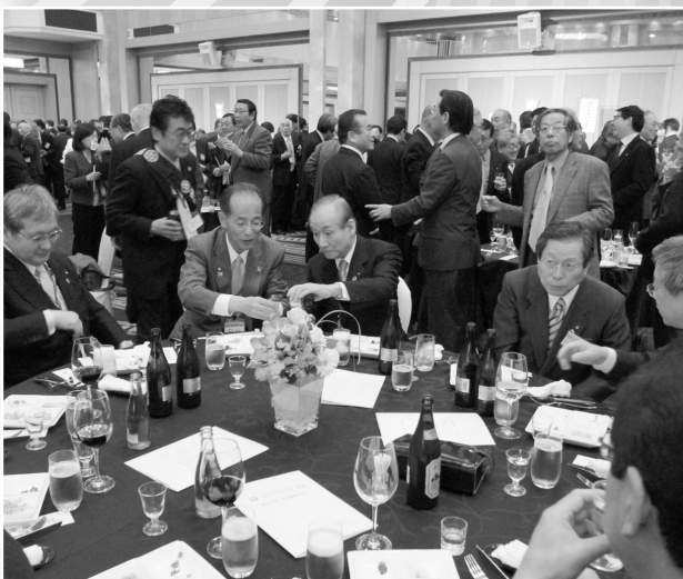
懇親の華が咲きました。