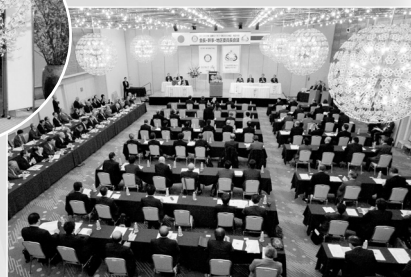
第1回 本会議スタート