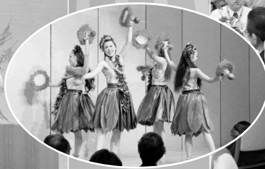
復興支援キャンペーン フラガールオンステージ