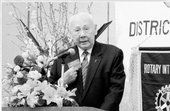
ビチャイ・ラタクルRI会長代理御挨拶