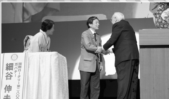
本会議のフィナーレです。