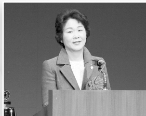
◀ 吉村美栄子山形県知事より御祝辞