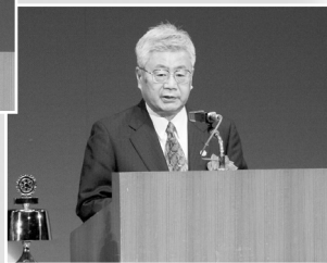
市川昭男山形市長より御祝辞 ▶