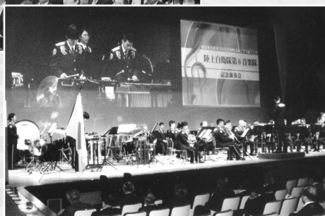
▼ 演奏 陸上自衛隊第6音楽隊