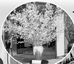
◀ 高知南RCからのお祝いの桜