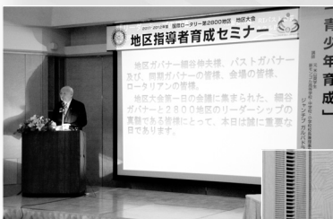
◀ 地区指導者育成セミナーで講演する ビチャイ・ラタクル氏