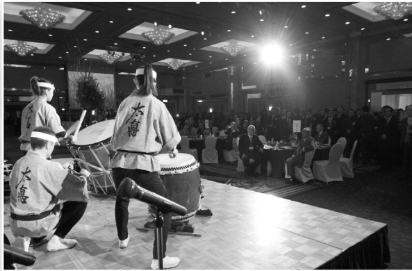
会員懇親の夕べのスタートです。