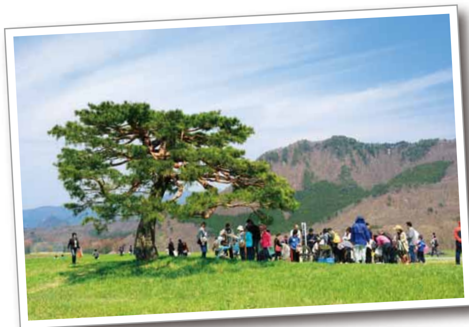
天童高原 ムサン 634の松

標高634mの天童高原にある「634の松(むさしのまつ)」と名付けられた松の木は、樹齢400年から500年とみられる名木。昨年5月に命名碑の除幕式を行いました。今後「634の松」は、天童高原のシンボルとして、地域活性化に活用していく計画です。