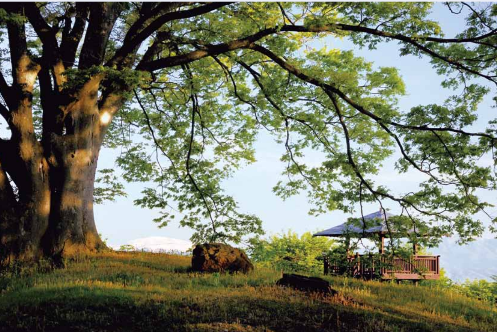
天童市・舞鶴山の大欅と月山