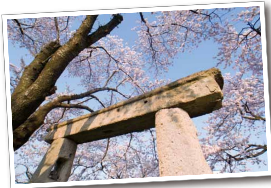
清池の石鳥居と桜