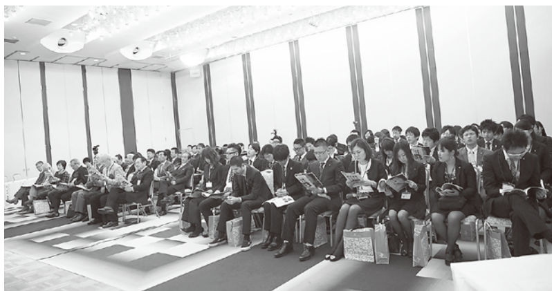
大会へは地区内ロータリアンをはじめ、他地区RACの皆さんが参加した