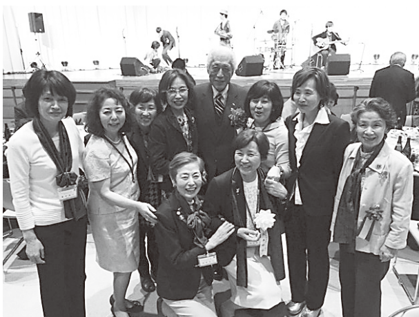
裏千家15代家元・千玄室氏と記念撮影