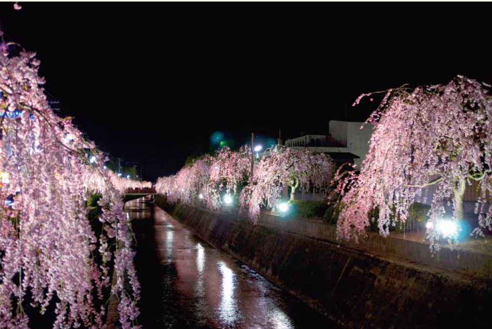
ライトアップされた水辺の桜