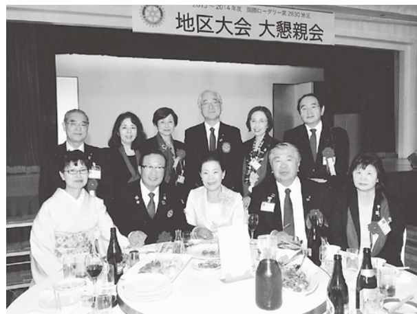
2830地区大会（八戸・10月）

これからさらに、4つの地区大会が続きますが、スペースの都合で次号に譲ります。それでは、6月号をお楽しみに。