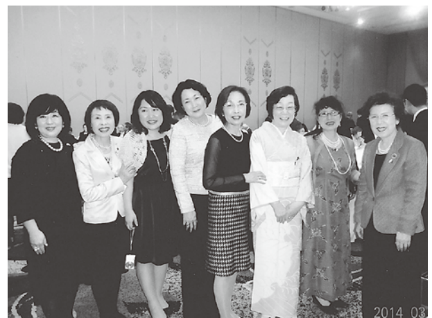
同期ガバナー夫人と