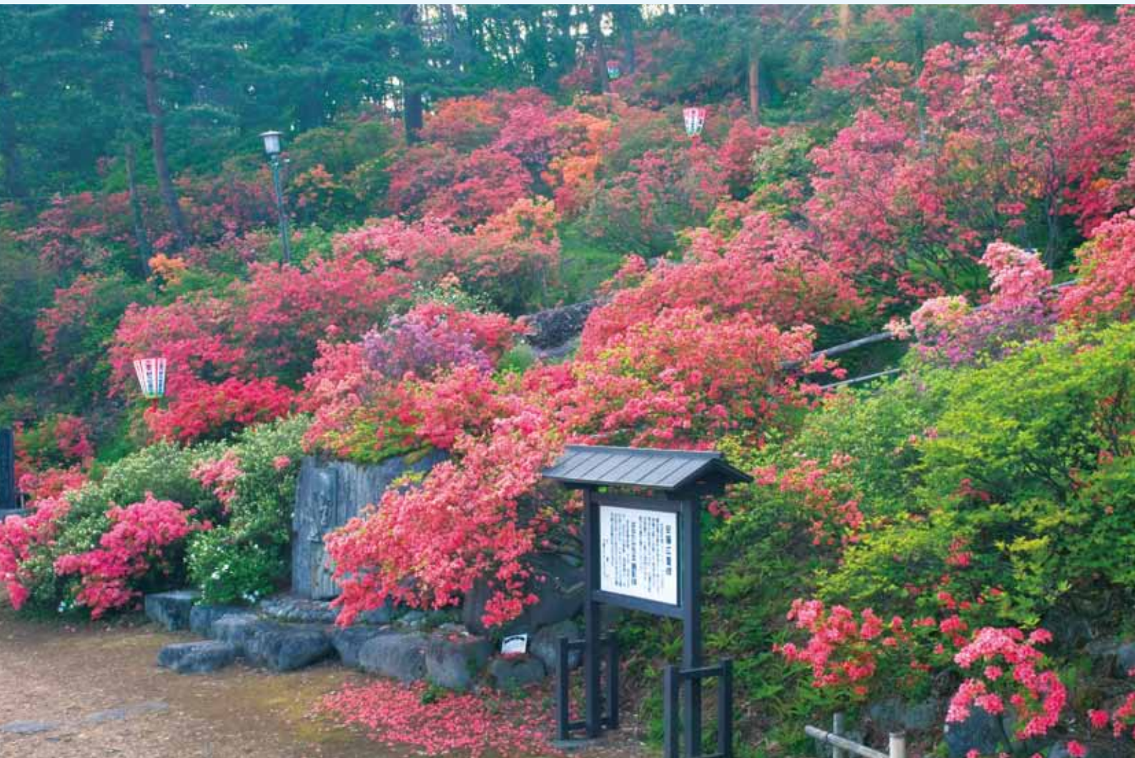
斜面に広がる躑躅の花