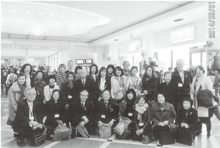
2680地区大会（宝塚）にて