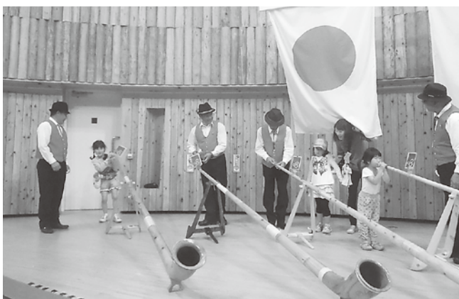
東日本大震災避難家族との交流会

たそばの試食にも満足していました。お昼が済むと広介生家にて地元の語り部の皆さんの昔語りを聞き、最後は山形ホルンクラブの演奏する音色に心も癒され、子ども達はホルンを手に音を出しては大喜びでした。帰り際に涙ぐみながら感謝とお礼を述べられる姿も見られ、逆に私達が感動を頂きました。