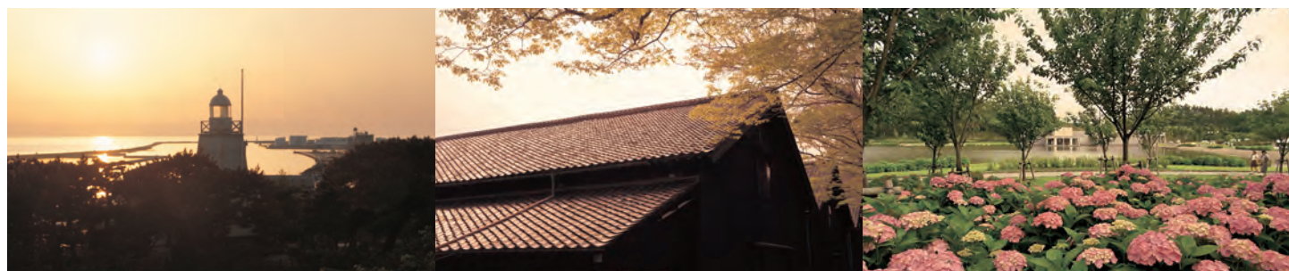
(写真左より) 日本海の夕日 | 新緑の山居倉庫 | 土門拳記念館と紫陽花