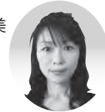
中野です。 どうぞ、 よろしく!