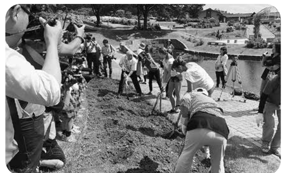
ブルガリアのバラの植樹会を開催