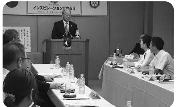
ガバナーの話に熱心に聞き入るメンバー