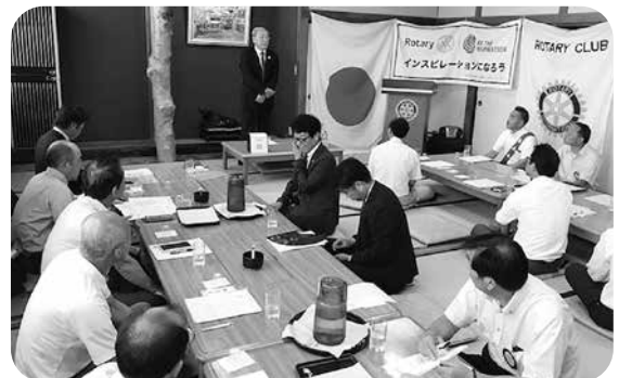
カメラをひいて、例会の全体風景