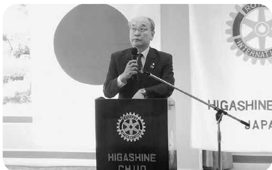
そう、私はお祭り大好き男です！