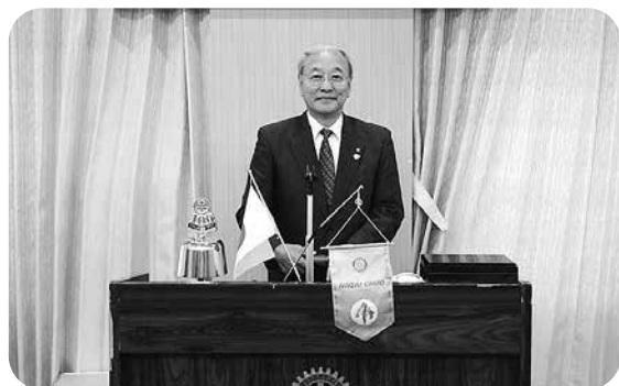
穏やかな顔をしています、ガバナー