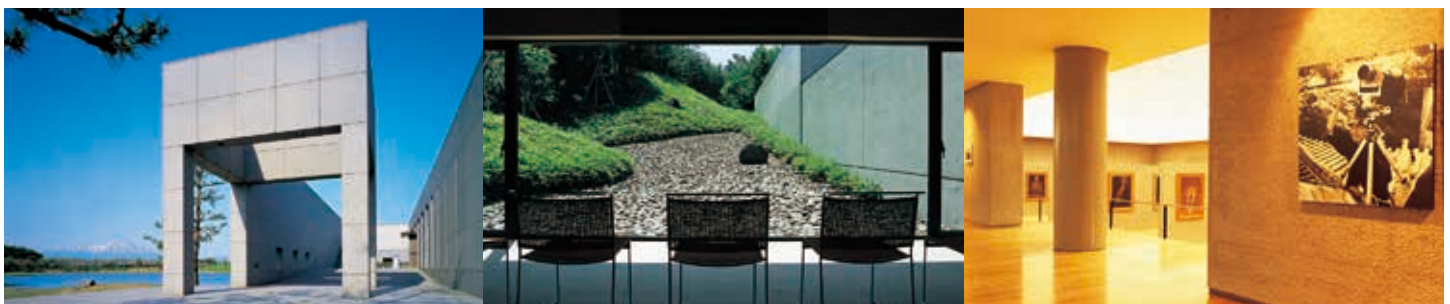
(写真左より) 土門拳記念館入口 | 勅使河原宏設計の庭 | 古寺巡礼の展示