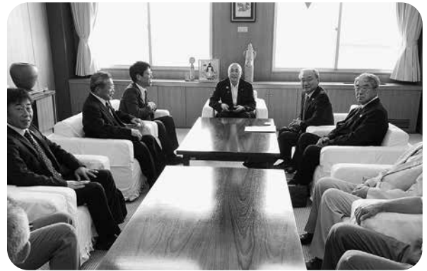
お忙しいなかありがとうございます。白岩市長。