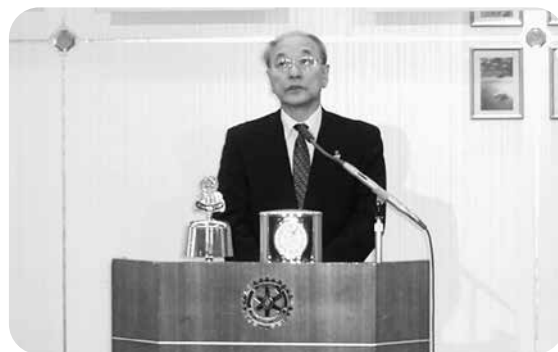
ガバナー、少しお疲れ気味でしょうか。