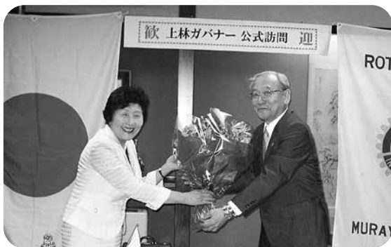
女性会員から花束をいただき、テレルガバナー