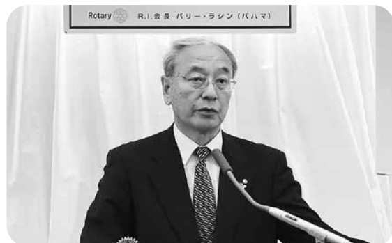
次年度は山形南RCです。そこのところよろしく!