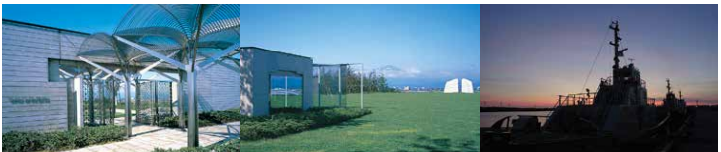
(写真左より) 酒田市美術館エントランス | 酒田市美術館から望む鳥海山 | 酒田本港の夕暮れ