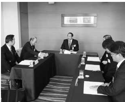
第1回本会議に先立ち開かれた地区大会委員会(選挙委員会)