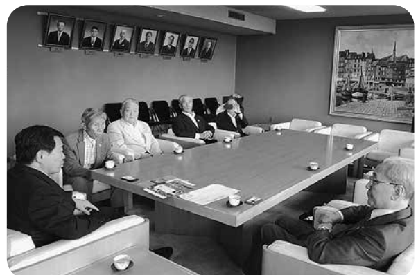
志布隆夫市長を囲む表敬訪問スタッフ

もなりました。ロータリーを市民に知っていただくために庁舎内に「ロータリーの友」を置かせていただくことになり、和やかな雰囲気ですべてを終えました。