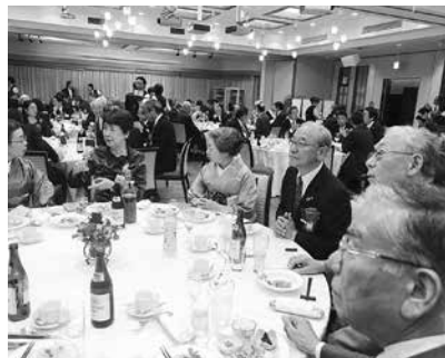
和やかに親睦と交流の時間が流れた歓迎晩餐会