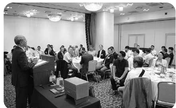
熱心に耳を傾ける山形北RCのメンバー