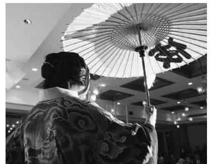
祝舞として披露された黒森歌舞伎の「白波五人男」に喝采が上がった