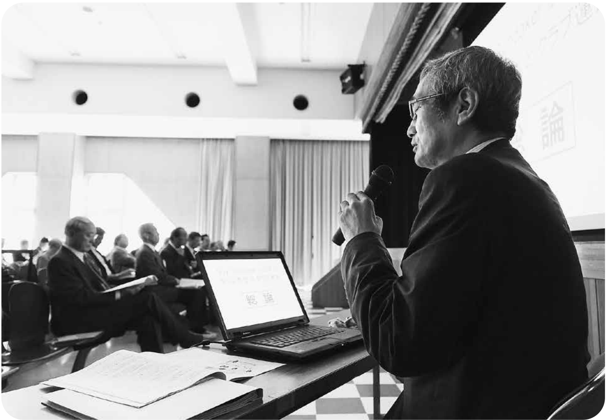
基調講演の鈴木一作直前ガバナーの ガイ・ガンデッカーについてのお話は 分かり易く、ふかく感銘を受けた。