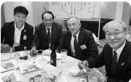
さすがにビール、イブニングクラブです。