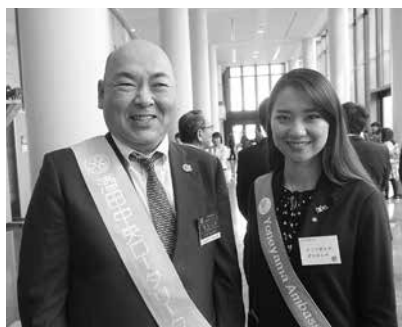
米山親善大使のエンボルドさんと記念すべきツーショット!