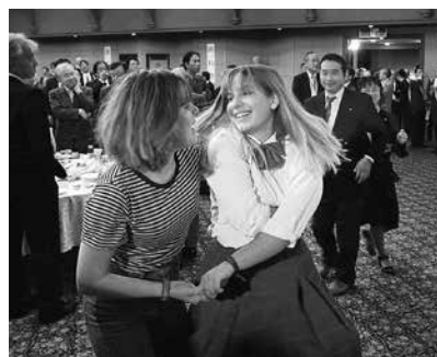
オールディーズの曲に乗って踊り出す交換学生たち。楽しそう!