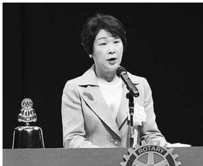
祝辞を述べられる 吉村美栄子山形県知事