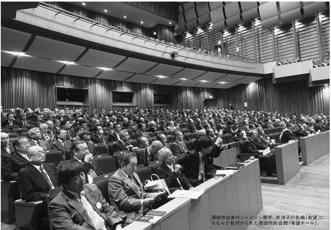
酒田市出身のシャンソン歌手、岸洋子の名曲「希望」にちなんで名付けられた酒田市民会館「希望ホール」。

Rotary International District 2800 2018-2019