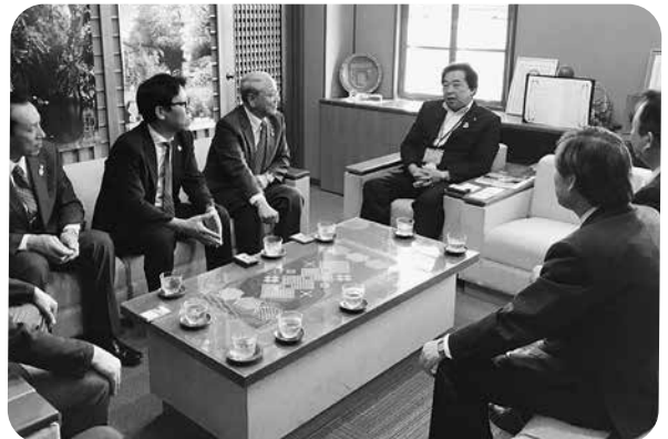
長井の船運業と酒田の海運業に話題が及んだ表敬訪問