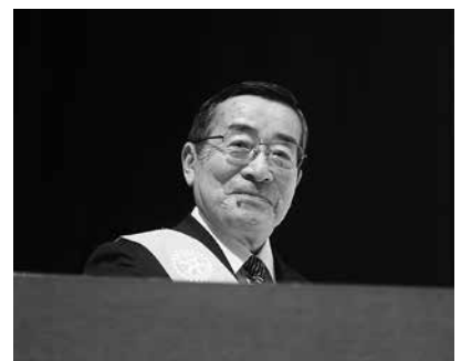
司会を担当した秋野明地区統括副幹事