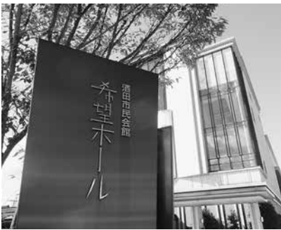
第2日の21日は朝から晴れわたり、気持ちのいい秋空がひろがった

青少年活動報告、米山奨学生活動報告では、国を越えて世界の明日を担う若者たちの姿をまぶしく見つめながら、ロータリーが担う国際交流事業の意義とその重要性をあらためて深く認識しました。